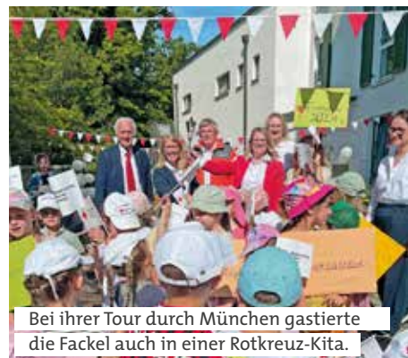
Bei ihrer Tour durch München gastierte die Fackel auch in einer Rotkreuz-Kita.

So überreichte die Schwesternschaft des BRK nach 157 Tagen am 18. Juni die Fackel dem BRK-Kreisverband München. Dort machte sie zunächst Station in der Kita „In den Kirschen“, um schon den Kleinsten die Bedeutung von Frieden näherzubringen. Anschließend ging es weiter ins Seniorenheim Haus Römerschanz, wo viele Bewohner selbst noch Kriegserfahrungen gemacht haben und Frieden nicht für selbstverständlich halten. Von dort aus brachten die Münchner die Fackel zum BRK-Kreisverband Rosenheim.