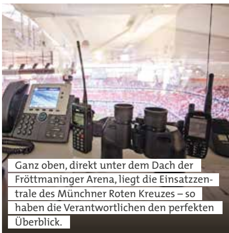
Ganz oben, direkt unter dem Dach der Fröttmaninger Arena, liegt die Einsatzzentrale des Münchner Roten Kreuzes – so haben die Verantwortlichen den perfekten Überblick.

Hunderttausende Besucher hielten sich während der EM-Spiele in der Landeshauptstadt auf. Es war klar, dass sich das auf das Einsatzaufkommen des Rettungsdienstes auswirken würde. Die Verantwortlichen des Münchner Roten Kreuzes reagierten mit einer stark erweiterten Vorhaltung. Zusätzliches Personal war rund um die Uhr im Dienst und besetzte weitere Rettungswagen und Krankentransport-Fahrzeuge. Eine Maßnahme, die sich während der Spiele in München dann auch als begründet erweisen sollte. Außerdem stellte das Münchner Rote Kreuz vier Schnelleinsatzgruppen Transport und eine Schnelleinsatzgruppe Behandlung zur Verfügung, die den Rettungsdienst bei Bedarf unterstützten.