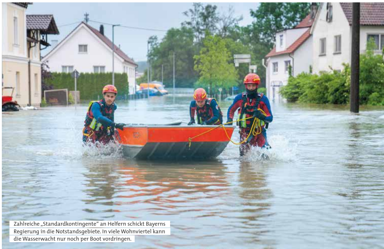
Zahlreiche „Standardkontingente“ an Helfern schickt Bayerns Regierung in die Notstandsgebiete. In viele Wohnviertel kann die Wasserwacht nur noch per Boot vordringen.