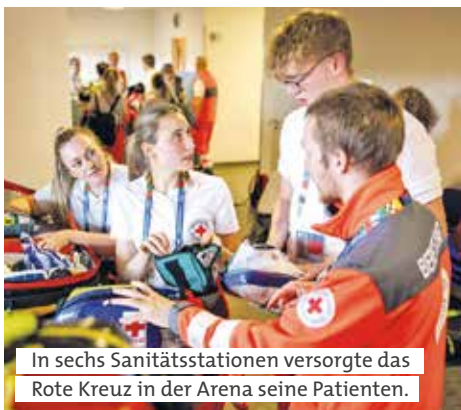
In sechs Sanitätsstationen versorgte das Rote Kreuz in der Arena seine Patienten.

Team der Psychosozialen Notfallversorgung des Münchner Roten Kreuzes zur Stelle, um sich im Ernstfall schnell um hilfsbedürftige Besucher, Dienstleister und Mitarbeitende kümmern zu können.