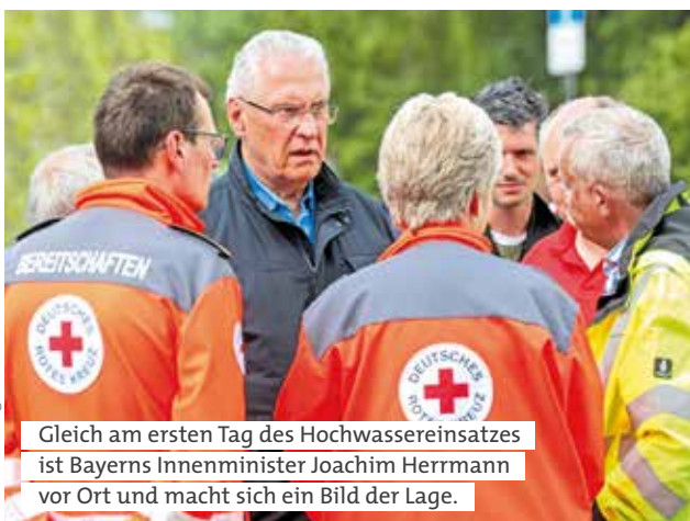
Gleich am ersten Tag des Hochwassereinsatzes ist Bayerns Innenminister Joachim Herrmann vor Ort und macht sich ein Bild der Lage.

Ein paar Wochen nach dem Hochwasser haben die drei Münchner Rotkreuzler Gelegenheit, sich mit Bayerns Innenminister Joachim Herrmann auszutauschen.