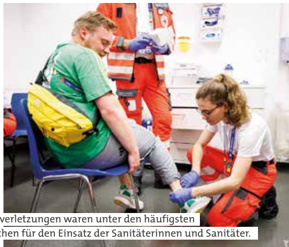
Sturzverletzungen waren unter den häufigsten Ursachen für den Einsatz der Sanitäterinnen und Sanitäter.