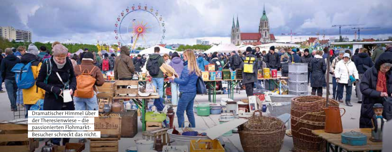
Dramatischer Himmel über der Theresienwiese – die passionierten Flohmarkt-Besucher schreckt das nicht.

Alljährlich Ende April treffen sich bis zu 3000 Verkäufer und etwa 80 000 Trödelfans aus ganz Europa zum BRK-Riesenflohmarkt auf der Theresienwiese. Im vergangenen Jahr dabei: die Sängerin Joelina Drews, die sich spontan in ein Paar knallrote Schuhe verliebte.