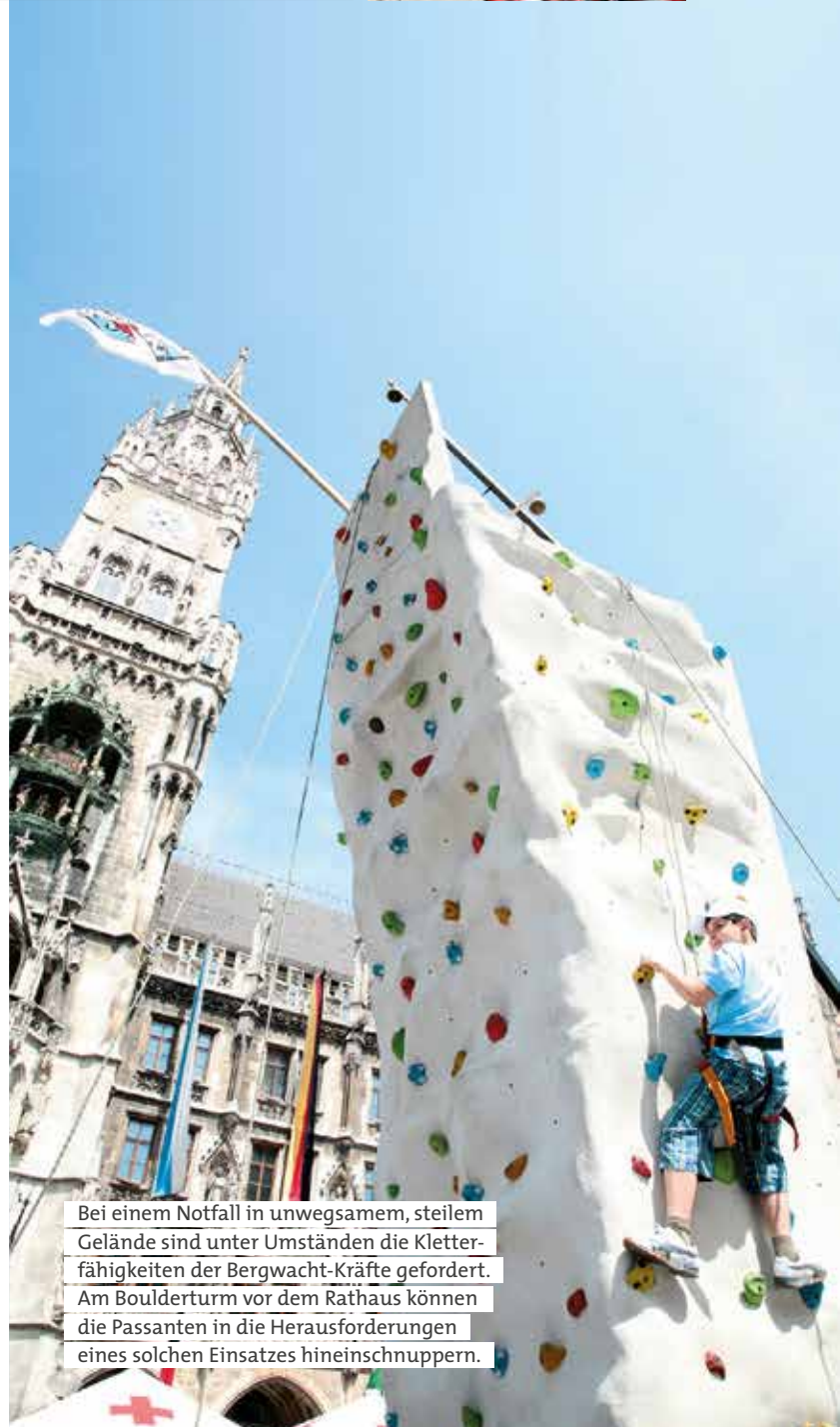
Bei einem Notfall in unwegsamem, steilem Gelände sind unter Umständen die Kletterfähigkeiten der Bergwacht-Kräfte gefordert. Am Boulderturm vor dem Rathaus können die Passanten in die Herausforderungen eines solchen Einsatzes hineinschnuppern.

KOMMEN SIE VORBEI – WIR FREUEN UNS AUF SIE!