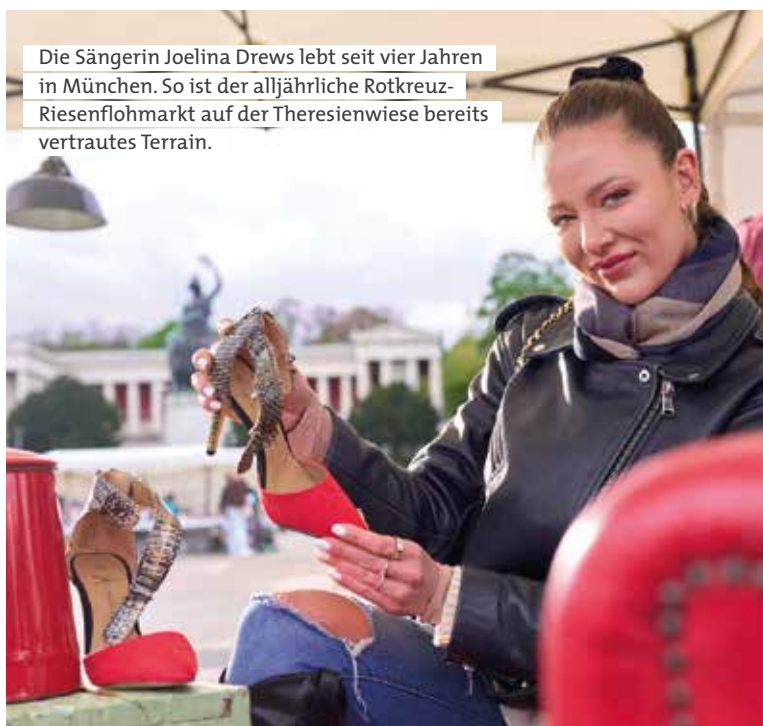
Die Sängerin Joelina Drews lebt seit vier Jahren in München. So ist der alljährliche Rotkreuz-Riesenflohmarkt auf der Theresienwiese bereits vertrautes Terrain.