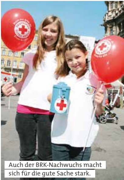
Auch der BRK-Nachwuchs macht sich für die gute Sache stark.

treff oder Krebsberatung – präsentiert sich an den Infoständen ebenso wie der Hausnotruf und „Essen auf Rädern“. Beim BRK-Glückshafen gewinnt fast jedes Los. Kinder können sich beim Kinderschminken des Jugendrotkreuzes eine fantasievolle Bemalung wünschen, während sich die Jugendlichen vielleicht über einen Praktikumsplatz, ein Freiwilliges Soziales Jahr oder eine Berufsausbildung beim Münchner Roten Kreuz informieren. Auch wer sich ehrenamtlich engagieren möchte, findet hier kompetente Ansprechpartner. Für das leibliche Wohl sorgt der Betreuungsdienst mit seiner nagelneuen Feldküche, der kostenlos Weißwürste ausgibt.