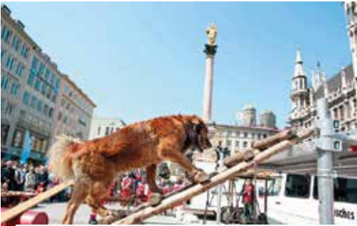
Das Münchner Rote Kreuz demonstriert, wie es mit Rettungshunden Verschüttete aufspürt, welche Fahrzeuge die Historie des Verbands begleitet haben und wie der Sanitätsdienst bei einer schweren Verletzung agiert.