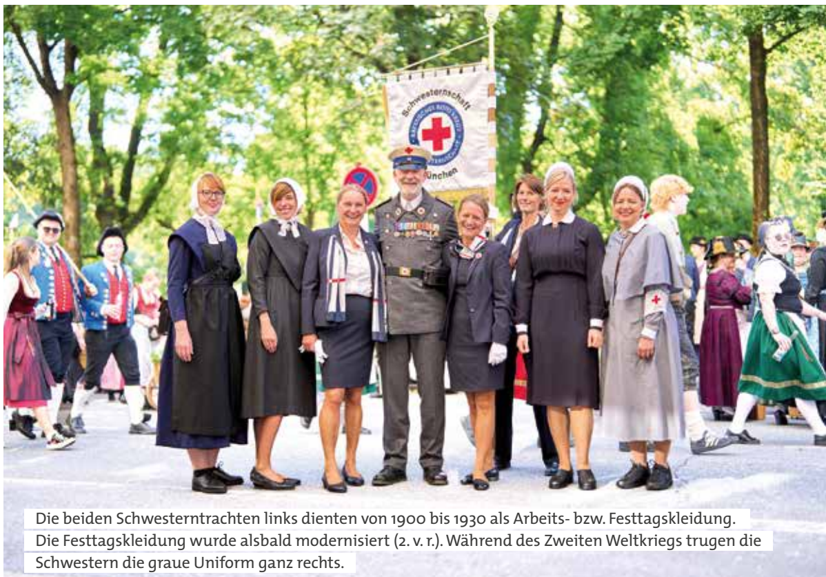
Die beiden Schwesterntrachten links dienen von 1900 bis 1930 als Arbeits- bzw. Festtagskleidung. Die Festtagskleidung wurde alsbald modernisiert (2. v. r.). Während des Zweiten Weltkriegs trugen die Schwestern die graue Uniform ganz rechts.

Die Mischung ist bunt: was die Uniformen, die Epochen, in denen sie getragen wurden, und auch die Zusammensetzung der Protagonisten betrifft. Bei der Aufstellung am Max-II-Denkmal finden sich Ehrenamtliche aus dem Münchner Rotkreuz-Museum, den Sanitätsbereitschaften sowie aus Wasserwacht und Bergwacht ebenso wie hauptamtlich Mitarbeitende aus der Obersendlinger Geschäftsstelle und dem Alten- und Servicezentrum Thalkirchen. Aber auch befreundete Partnerverbände unterstützen die Aktion, so die Schwesternschaften, der Historische Zug Holzkirchen und das