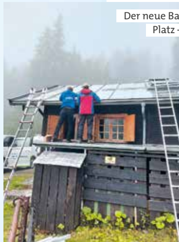
Der neue Batteriespeicher fand im Hütteninneren Platz – hier in der Diensthütte „Maxlrainer“.

Die Stadtwerke München unterstützen die Bergwacht München mit Photovoltaik-Anlagen.