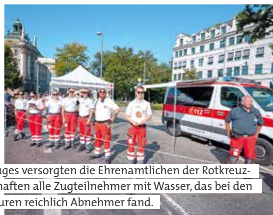
Am Rande des Zuges versorgten die Ehrenamtlichen der Rotkreuz-Sanitätsbereitschaften alle Zugteilnehmer mit Wasser, das bei den hohen Temperaturen reichlich Abnehmer fand.