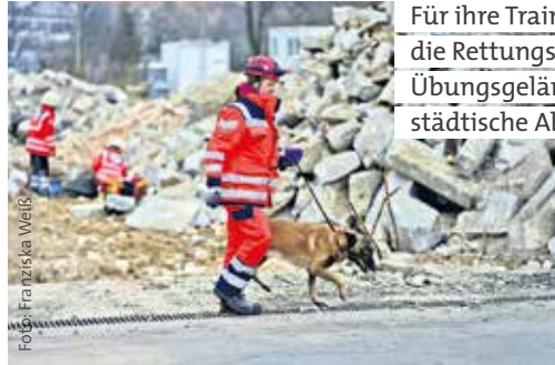
Für ihre Trainings und Prüfungen kann die Rettungshundestaffel stillgelegte Übungsgelände der Bundeswehr oder städtische Abrissflächen nutzen.

freundlich auf Menschen reagieren, mit Futter oder Spielzeug motivierbar und außerdem belastbar sein. Bei einem Hausbrand zum Beispiel verursachen die Generatoren der Feuerwehr einen ungeheuren Lärm, dazu Blaulicht, viele Menschen, ungewohnte Gerüche. Daneben sind Selbstbewusstsein und Geländehärte unverzichtbar, denn bei einer Suche läuft der Hund unter Umständen durch meterhohen Schnee oder im Dunkeln durch den Wald. Er trifft auf Menschen, die er nicht kennt, die sich beim Auffinden vielleicht auch unerwartet benehmen. Und nicht immer endet ein Einsatz mit einem Erfolg. Das darf den Hund dann nicht entmutigen und ihm den Spaß am Suchen nehmen.“