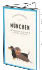
Cover: Inset Verlag

Diesmal gibt es 4 x den „Lieblingsorte“-Reiseführer „München“ zu gewinnen: Auch Einheimische werden überrascht sein, was es noch alles zu entdecken gibt, zum Beispiel versteckte Plätze und Parks, ausgefallene Geschäfte oder angesagte Cafés, Restaurants und Bars.