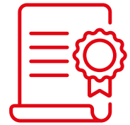
Illustration: Freepic, FlatIcon/Luica Fish, DyrhCrieshaber

Gratulation den aktuellen Absolventen und Absolventinnen der Berufsfachschule für Notfallsanitäter an der Rotkreuz-Akademie, die ihre dreijährige Ausbildung kürzlich erfolgreich abgeschlossen haben. Viele davon bleiben dem Roten Kreuz erhalten und unterstützen künftig den Münchner Rettungsdienst.