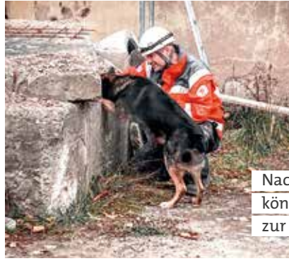
Nach zweieinhalb Jahren Ausbildung können die Ehrenamtlichen ihre Tiere zur Rettungshundeprüfung anmelden.