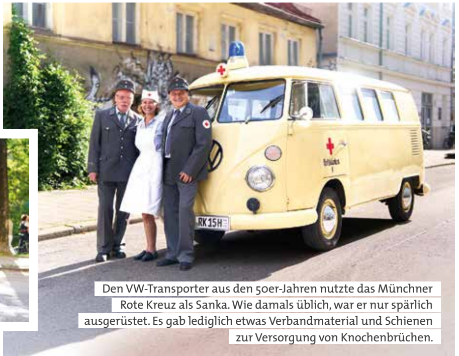
Den VW-Transporter aus den 50er-Jahren nutzte das Münchner Rote Kreuz als Sanka. Wie damals üblich, war er nur spärlich ausgerüstet. Es gab lediglich etwas Verbandmaterial und Schienen zur Versorgung von Knochenbrüchen.

Die Mischung ist bunt: was die Uniformen, die Epochen, in denen sie getragen wurden, und auch die Zusammensetzung der Protagonisten betrifft. Bei der Aufstellung am Max-II-Denkmal finden sich Ehrenamtliche aus dem Münchner Rotkreuz-Museum, den Sanitätsbereitschaften sowie aus Wasserwacht und Bergwacht ebenso wie hauptamtlich Mitarbeitende aus der Obersendlinger Geschäftsstelle und dem Alten- und Servicezentrum Thalkirchen. Aber auch befreundete Partnerverbände unterstützen die Aktion, so die Schwesternschaften, der Historische Zug Holzkirchen und das