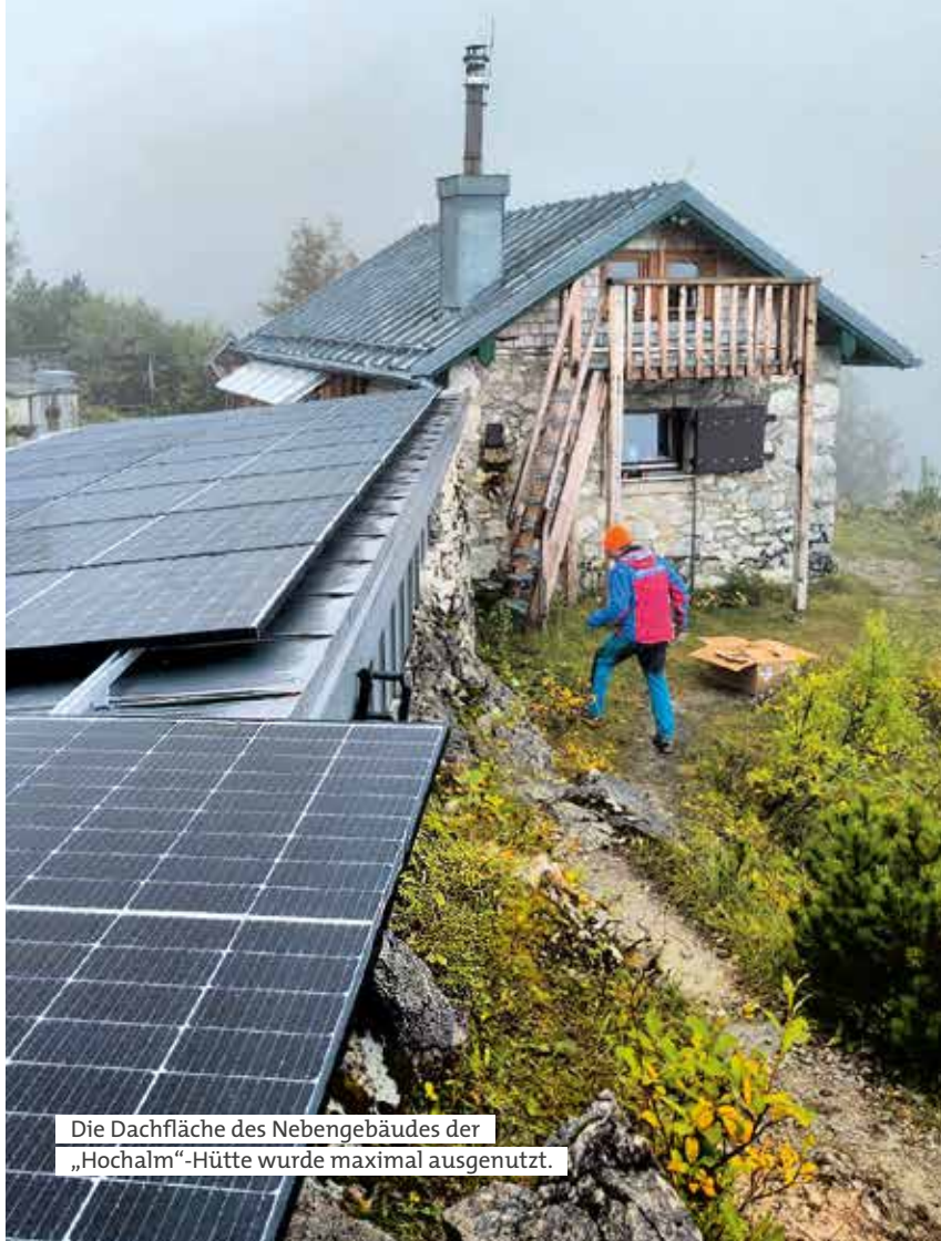
Die Dachfläche des Nebengebäudes der „Hochalm“-Hütte wurde maximal ausgenutzt.

Seit ihrer Gründung 1920 setzt sich die Bergwacht München für die Sicherheit in den bayerischen Bergen ein und unterstützt dabei eng die lokalen Bergwacht-Bereitschaften vor Ort. Bei Wind und Wetter stehen ihre ehrenamtlichen Bergretterinnen und Bergretter bereit, um Menschen in Not zu helfen – bei Unfällen im alpinen Gelände, medizinischen Notfällen oder Sucheinsätzen. 200 Mitglieder, davon 110 aktive Einsatzkräfte und 42 engagierte Anwärter, setzen sich in ihrer Freizeit für die Sicherheit anderer ein – zu 100 Prozent ehrenamtlich.