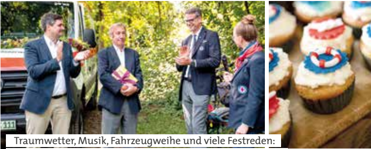
Traumwetter, Musik, Fahrzeugweihe und viele Festreden: Die Isarrettung wusste ihren runden Geburtstag zu feiern.