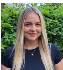
Lara Foniqi Verwaltung