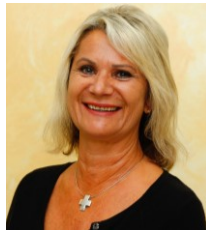
Inge Disanto Verwaltung