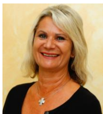
Inge Disanto Verwaltung